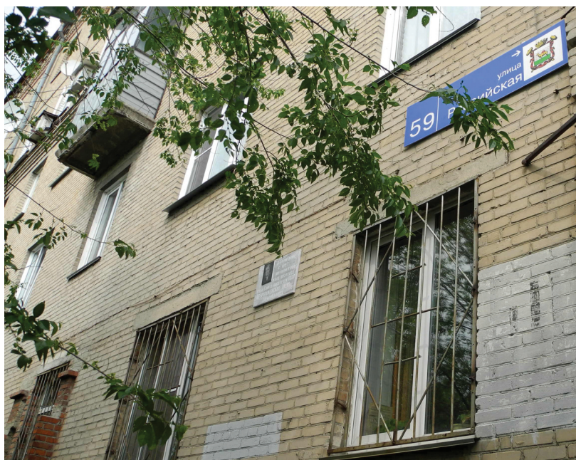
Фото: Е. С. Меньшенина

Ист.: Челябинск : энциклопедия. http://www.book-chel.ru .