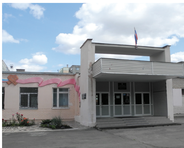
Фото В. Б. Феркель

Ист.: Челябинск : энциклопедия. URL: http://www.book-chel.ru .