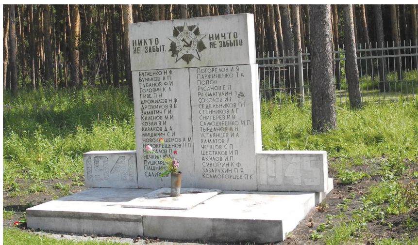
Фото В. Б. Феркель

Ист.: Челябинск : энциклопедия. URL: http://www.book-chel.ru .