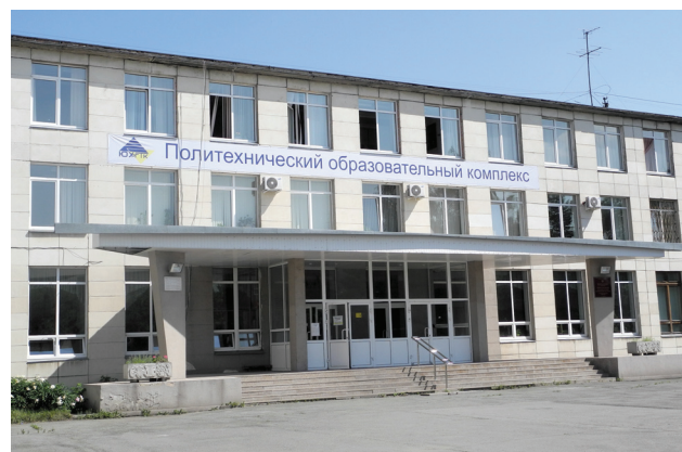
Фото: В. Б. Феркель

Ист.: Павшие в Афганской войне. Челябинская область. http://gunmaker-t.narod.ru .