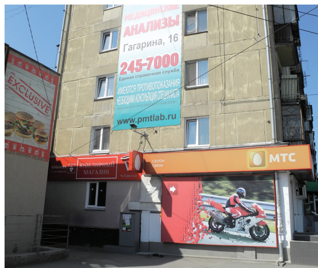
Фото: В. Б. Феркель

Ист.: https://ru.wikipedia.org/wiki/Держинский,_Феликс_Эдмундович .