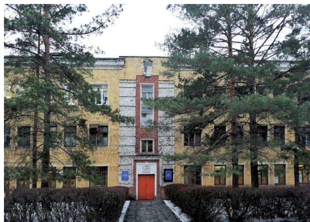
Фото: архив музея ЧМК

Ист.: http://www.chelindustry.ru/view2.php?idd=1&gr=1 ; Время. Люди. Сталь: [к 70-летию Челябинского металлургического комбината / авт.-сост. Л. П. Ярош]. Челябинск, 2013.