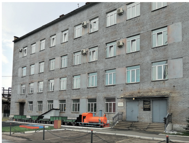
Фото: архив музея ЧМК

Ист.: Челябинск : энциклопедия. URL: http://www.book-chel.ru .