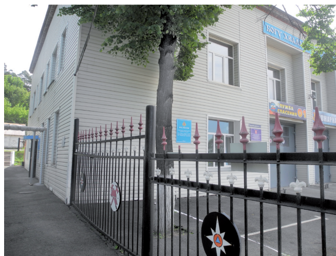
Фото: Е. С. Меньшенина

Ист.: http://g-miass.ru/novosti/2642_zavekovuyu-istoriyu-pozharnoy-ohrany-tolko-odin-miasec-pogib-pri-ispolnenii-sluzhebno-dolga.php