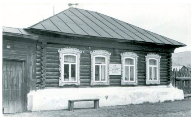
Фото: Миасский городской краеведческий музей

Ист.: http://www.miass.info/slovari/article.php?article=479