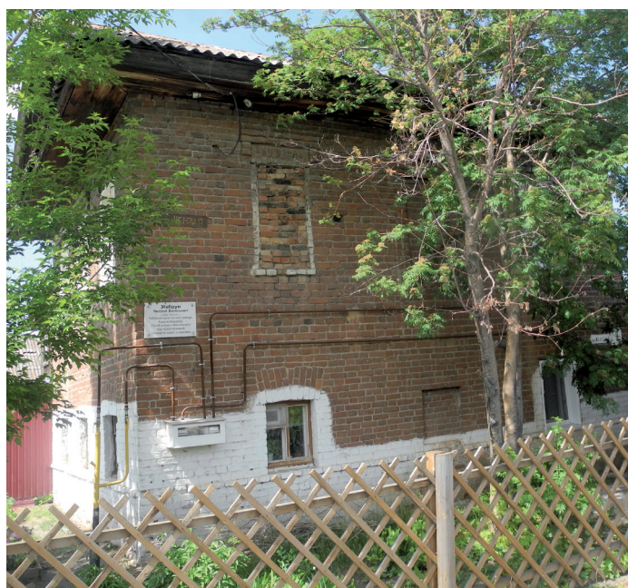
Фото: В. Б. Феркель

Ист.: http://www.miass.info/slovari/article.php?article=104