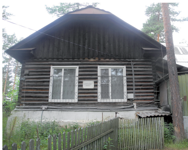
Фото: В. Л. Королев, В. Б. Феркель

Ист.: Миасс : энциклопедический словарь. Миасс : Геотур, 2003.