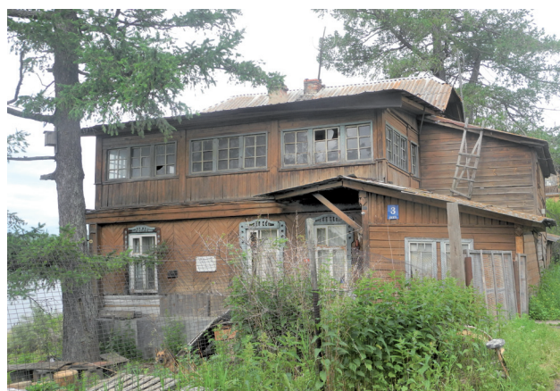
Фото: В. Л. Королев, В. Б. Феркель

Ист.: https://ru.wikipedia.org/wiki/Академия_наук_СССР