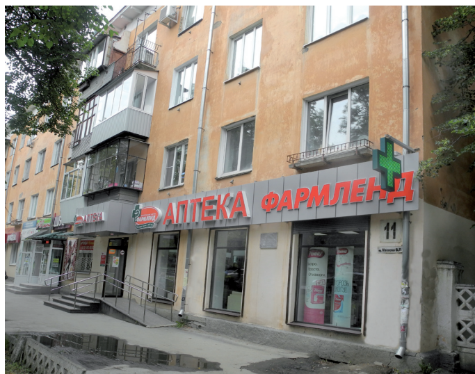
Фото: М. В. Ненароков, В. Б. Феркель

Ист.: https://ru.wikipedia.org/wiki/Машгородок