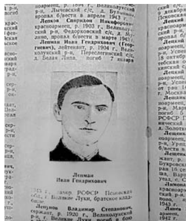
Запись в Книге памяти Великих Лук

За мужество и героизм, проявленные в Великолукской операции, более 10 тыс. наших бойцов и командиров были удостоены высоких правительственных наград.