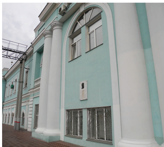
Фото: В. С. Колпакова, В. Б. Феркель

Ист.: Челябинск : энциклопедия. URL: http://www.book-chel.ru .