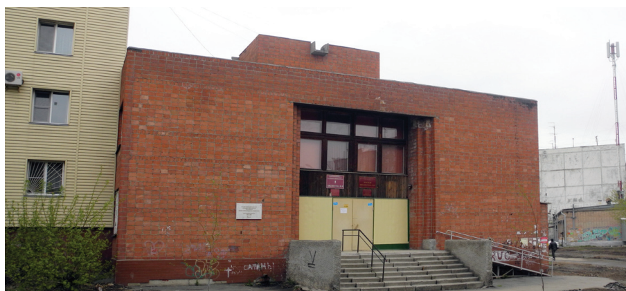
Фото: В. Б. Феркель

Ист.: Малютин Иван Петрович // Объединенный государственный архив Челябинской области. URL: http://archive74.ru/malyutin-ivan-petrovich .