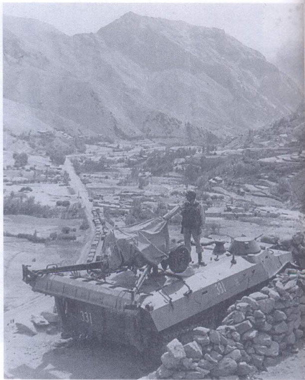
Выносной пост в районе перевала Саланг