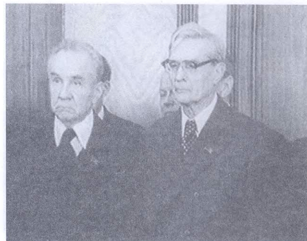
Председатель Совета Министров А. Н. Косыгин и заведующий идеологическим отделом ЦК КПСС М. А. Суслов. 18.03.1979 г.