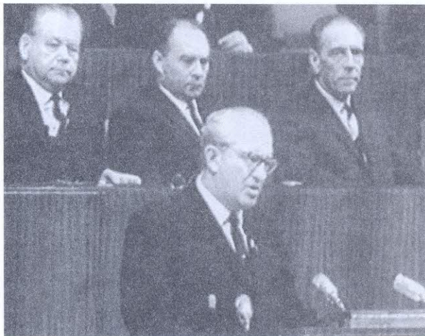
Председатель КГБ СССР Ю. В. Андропов. 18.03.1979 г.