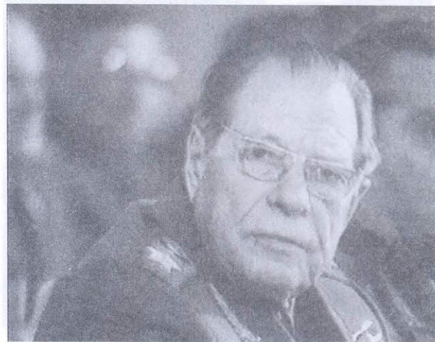
Министр обороны СССР Д. Ф. Устинов. 18.03.1979 г.