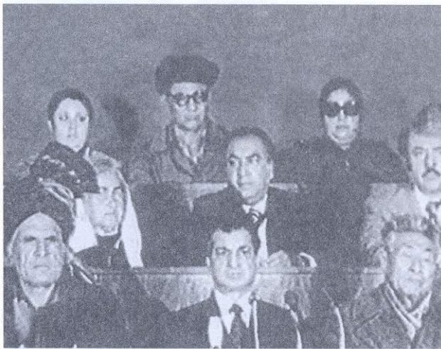
Бабрак Кармаль среди руководящего состава НДПА. Март 1979 г.