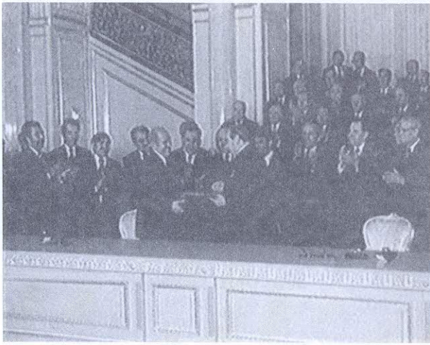
Взаимный обмен подписанными Договорами о дружбе, сотрудничестве и взаимной помощи. Москва, 1978 г.