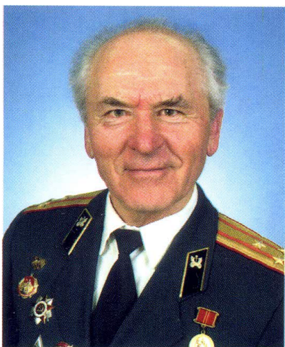
Рыжков Н. М.