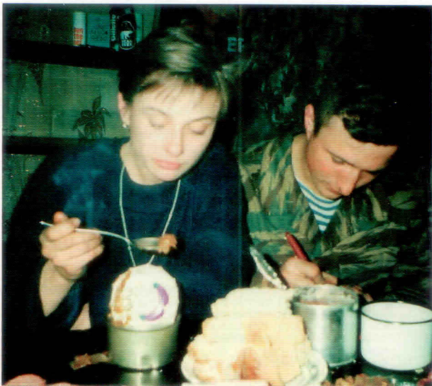
С женой в Чечне