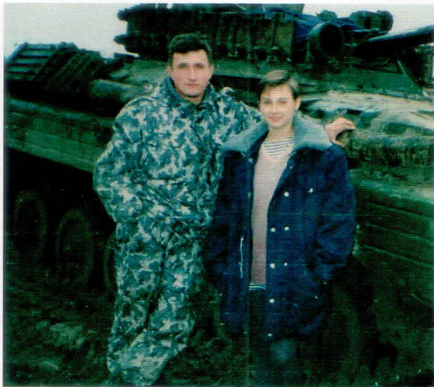
С женой в Чечне

31 мая 1999 года, находясь в отпуске, решили съездить на несколько дней к морю. Хорошая трасса Ростов — Краснодар, отремонтированная маши-