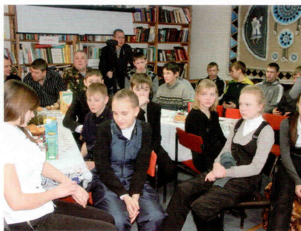
День война-интернационалиста в ВСОШ. 2015 г.