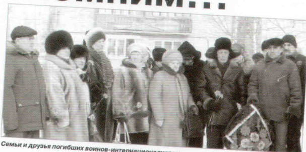
Семьи и друзья погибших воинов-интернационалистов