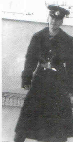
1984 год. В учебно-маршовой школе.

Свет далекой звезды Андрея привели к семейной части, которая совсем не погас. Вот он пробивает толпу злым плутом. Он полой сияния на главной Золотой Звезде Героя, излучая глумливую звезду. Ему там - в небесной де вернется и слышится.