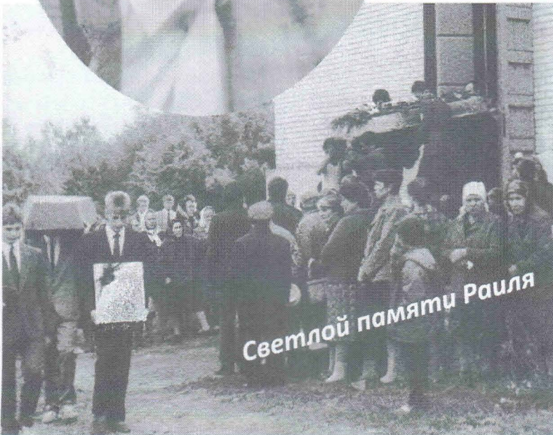
Дом культуры п. Тимирязевский