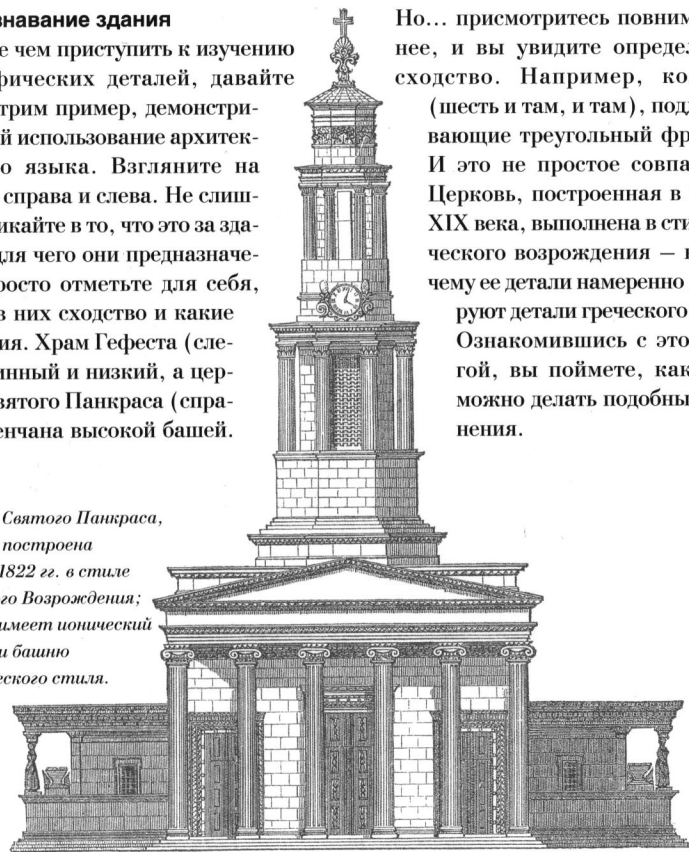
Церковь Святого Панкраса, Лондон, построена в 1819–1822 гг. в стиле греческого Возрождения; церковь имеет ионический портик и башню классического стиля.

Но... присмотритесь повнимательнее, и вы увидите определенное сходство. Например, колонны (шесть и там, и там), поддерживающие треугольный фронтон. И это не простое совпадение. Церковь, построенная в начале XIX века, выполнена в стиле греческого возрождения — вот почему ее детали намеренно имитируют детали греческого храма. Ознакомившись с этой книгой, вы поймете, как легко можно делать подобные сравнения.