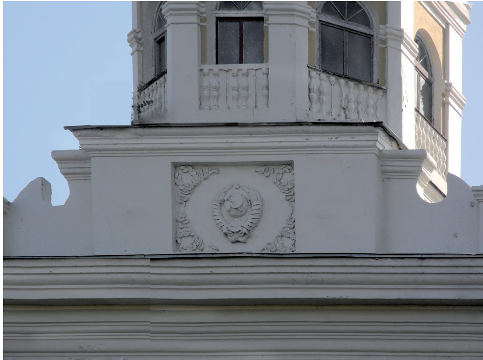
Аттик с лепным гербом