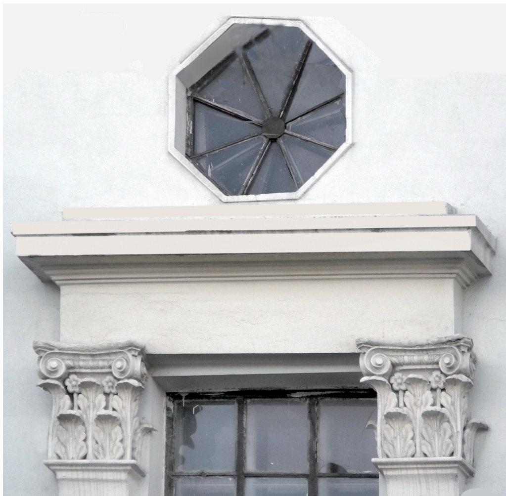
Восьмиугольный оконный проем, сандрик и капители пилястр