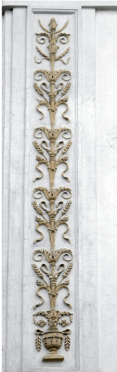
Лопатка с барочным орнаментом