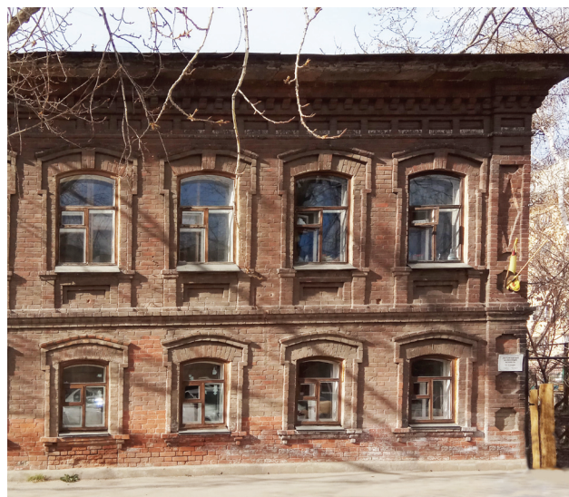
Фото: Е. С. Меньшенина

Ист.: https://2gis.ru/chelyabinsk/geo/2111697980514635 .