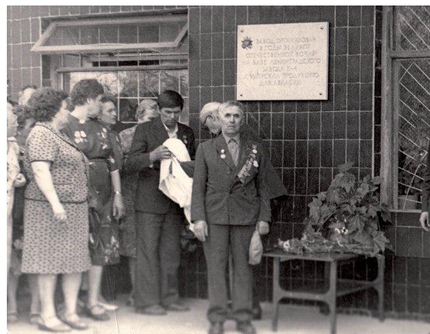
Фото: В. Б. Феркель, архив

Ист.: Челябинск : энциклопедия. URL: http://www.book-chel.ru ; личный архив З. Д. Шульмана.