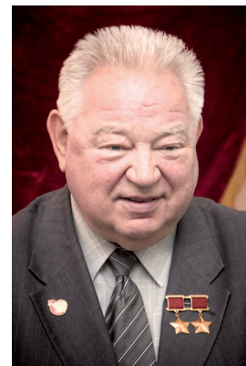
Г. М. Гречко

ГРЕЧКО Георгий Михайлович (25.05.1931, Ленинград — 08.04.2017, Москва), советский космонавт, дважды Герой Советского Союза (1975, 1978), ЧССР (1978), летчик-космонавт СССР № 34 (1975), Доктор физико-математических наук (1984). В 1955 окончил с отличием Ленинградский механический институт, работал в ОКБ-1. С 1966 в отряде космонавтов. Совершил за свою профессиональную карьеру три космических полета (1975, 1977—1978, 1985), общая продолжительность которых составляет 134 дня 20 часов 32 минуты и 58 секунд. Совершил один выход в открытый космос на 1 час 28 минут. В 1968—1969 входил в группу советских космонавтов, готовившихся по советским программам облета Луны Л1/«Зонд» и посадке на нее Л3 (полеты не состоялись). Спортивные достижения: кандидат в мастера спорта по автоспорту, 1-й разряд по парашютному спорту (64 прыжка), 2-е разряды по планеризму