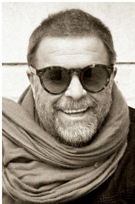
Б. Б. Гребенщиков