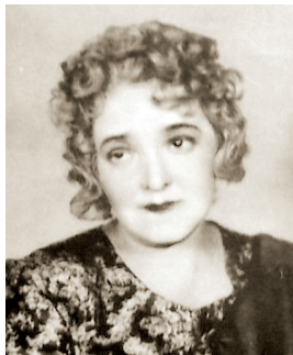
Н. О. Григорьевская

ГРИГОРОВСКАЯ Нина Осиповна (1898—1957, Москва), актриса театра, заслуженная артистка МАССР. В 1916—1957 актриса Малого театра. В 1941—1942 с театром в эвакуации в Челябинске.