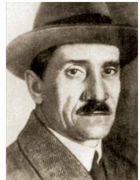
А. С. Грин

Лит.: «Рекрут Грин» в Челябинске / Э. Подтяжкин // ВЧ. 1975. 28 февр.