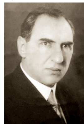
Г. И. Гутман

ГУТМАН Григорий Исаакович (18.09.1895 — 29.11.1979, Липецк), артист оригинального жанра, психоэкспериментатор («человек-радио»), гипнотизер. Первым в СССР, в 1933 ввел гипноз в эстрадно-искусство. Был блестящим актером, кроме безупречной техники гипноза обладал выразительными жестами и прекрасно поставленной речью. За 60 лет работы провел более двадцати тысяч сеансов гипноза и объездил весь Советский Союз. 11.12.1945 выступил в театре оперетты (Челябинск; ассистент Н. Гутман).