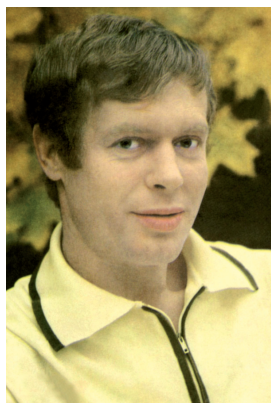
Б. Н. Гусаков

ГУСАКОВ Борис Николаевич (05.05.1941 — 17.09.2015, г. Ногинск Московской обл.), актер театра и кино. Учился в театральном училище в Свердловске. Играл в Шадринском драматическом театре, в Томском драмтеатре. В 1971 окончил Школу-студию МХАТ (курс В. Манюкова). В 1971—1975 актер Московского художественного академического театра им. М. Горького. В 1975—1989 актер Московского Нового драматического театра. Снимался в кино: «Визит вежливости» (1972), «Мир в трех измерениях» (1979, фильм был снят на территории ЧТПЗ), «Территория» (1998) и другие фильмы. В 2000 оставил актерскую профессию по состоянию здоровья.