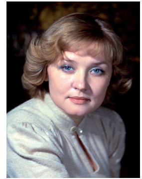
В. В. Алентова