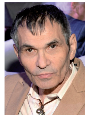
Б. К. Алибасов

АЛИБАСОВ Бари (Бауыржан) Каримович (Борис Николаевич; 06.06.1947, Чарск Семипалатинской обл. Казахской ССР), советский и российский музыкант, композитор, музыкальный продюсер, заслуженный артист России (1999). С 1965 учился в Усть-Каменогорском строительном институте (ныне Восточно-Казахстанский государственный технический университет). В 1966 вместе с М. Араповым организовал музыкальную группу «Интеграл» (при Усть-Каменогорском строительном институте, с 1973 при Восточно-Казахстанской областной филармонии). В 1969—1971 проходил службу в СА, создал ансамбль «Задор» при штабе ПВО САВО. 1973—1974 учился в Усть-Каменогорском музыкальном училище по классу ударных, не окончил. В 1989 распустил группу «Интеграл». Организатор и бессменный руководитель поп-группы «На-На». Режиссер 9 шоу-программ,