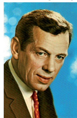
Г. С. Жженов

ЖЖЕНОВ Георгий Степанович (09(22).03.1915, Петроград — 08.12.2005, Москва), актер театра и кино, народный артист СССР (1980), лауреат Государственной премии РСФСР (1975; за роль Бессонова в фильме «Горячий снег»). Окончил акробатическое отделение Ленинградского эстрадно-циркового техникума (1932), отделение кино Ленинградского института сценических искусств (1935). Ученик С. А. Герасимова. В 1945—1946 актер Заполярного драматического театра, в 1947—1948 — Свердловской киностудии, в 1948—1949 — драматического театра г. Павлов-на-Оке, в 1954—1962 — Ленинградского областного драматического театра; играл в Ленинградском театре им. Ленсовета, с 1968 — в Театре им. Моссовета. Был дважды репрессирован (1939, 1949); в 1955 реабилитирован. Исполнил более 100 театральных ролей, снялся в десятках художественных фильмов: «Берегись автомобиля» (1966), «Путь в "Сатурн"» (1967), «Ошибка резидента» (1968), «Вся королевская рать» (1971), «Экипаж» (1980). Принял участие в создании 5-серийного теле-