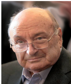
М. М. Жванецкий

ЖВАНЕЦКИЙ Михаил Михайлович (Маньевич; 06.03.1934, Одесса, УССР), русский писатель-сатирик и исполнитель собственных литературных произведений, народный артист Украины (1999), народный артист Российской Федерации (2012), член СП СССР, почетный гражданин города Одессы. Из семьи врачей. Окончил Одесский институт инженеров морского флота по специальности