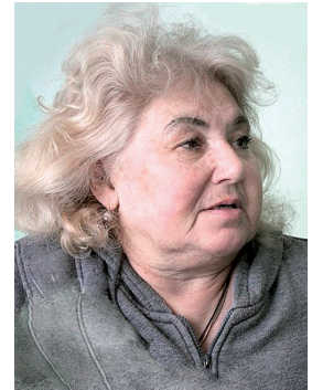
М. М. Запашная

Лит.: [О новой программе цирка] // ВЧ. 1982. 20 марта.