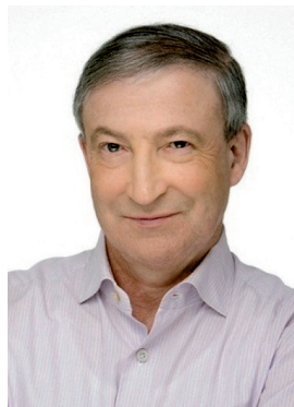
С. Т. Альтов

АЛЬТОВ Семён Теодорович (фамилия при рождении Альтшуллер; 17.01.1945, Свердловск), советский и российский писатель-сатирик, сценарист, режиссер, заслуженный деятель искусств Российской Федерации (2003). Окончил Ленинградский технологический институт имени Ленсовета. Писать начал в 1971. Его произведения исполняли Г. Хазанов («Геракл», «Вобла», «Хор в посольстве», «Волки и овцы»), К. Новикова («Кармен»), Е. Шифрин («Кающаяся Мария Магдалина», «Покушение», «Блуждающая грудь», «Золушка», «Оазис», «Сексонфу», «Бычара», «Личный пример»), В. Винокур («Кувырок судьбы»). Выступал со своими произведениями. Автор последнего спектакля А. Райкина «Мир дому твоему». Участвовал в телепередачах «Комната смеха», «Без антракта», «Измайловский парк», «Джентльмен-шоу», «Юрмала», «Вечерний Квартал», «Вокруг смеха», «Недотепы» и в других юмористических передачах. В феврале 1998 выступал в Челябинске (программа «Собачьи радости»). Лауреат международного фестиваля сатиры и юмора «Золотой Остап» (1994). Лауреат Кубка Аркадия Райкина на международном фестивале «MORE СМЕНА» (Рига; 2001). Снимался в кино.