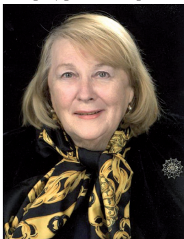
Л. И. Иванова

ИВАНОВА Людмила Ивановна (22.06.1933, Москва — 07.10.2016, Санкт-Петербург, похоронена в Москве), советская и российская актриса театра и кино, народная артистка РСФСР (1989), бард, член СП России (2014). В 1955 окончила школу-студию МХАТ (курс А. М. Карева) и была принята в труппу Московского передвижного драмтеатра. С 1957 работала в театре «Современник», сыграла на сцене театра более 40 разнопла-