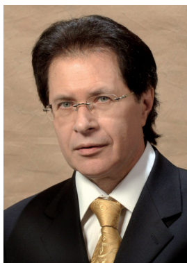
О. Б. Иванов

ИВАНОВ Олег Борисович (27.12.1947, Барнаул), советский и российский композитор, народный артист РФ (2006), лауреат премии Ленинского комсомола (1982), заслуженный деятель искусств РФ (1996). Окончил Алтайский медицинский институт, Новосибирскую консерваторию по классу композиции (1976). Сочинял песни, сотрудничал с музыкальными коллективами и эстрадными артистами. С 1978 член СК СССР. С 1994 член Международного союза эстрадных деятелей. В сентябре 2000 побывал в Челябинске. Шестнадцатикратный лауреат конкурса «Песня года». Председатель песенной комиссии Союза московских композиторов, председатель жюри международного конкурса-фестиваля «Красная гвоздика», член Общественной Палаты Союзного государства РФ и республики Беларусь. Лауреат премии Союзного государства РФ и республики Беларусь в области литературы и искусства (2018).