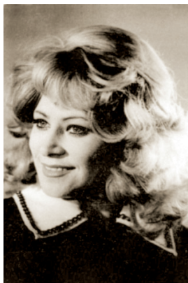
З. Л. Иванова

ИВАНОВА Зоя Леонидовна (26.04.1934, Днепропетровск), артистка оперетты, заслуженная артистка РСФСР (1970), народная артистка РСФСР (1978), жена Г. Гринера. В 1956 окончила Днепропетровский институт иностранных языков, в 1961 — Днепропетровское музыкальное училище. С 1961 солистка Киевского театра музкомедии, с 1963 — Московского театра оперетты. В январе 1978 на гастролях в Челябинске (оперетта «Летучая мышь»). С 1989 живет в США.