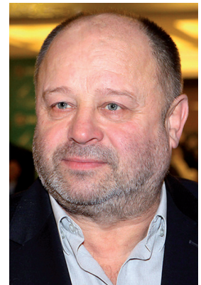
В. А. Ильин

ИЛЬИН Владимир Адольфович (16.11.1947, Свердловск), советский и российский актер театра и кино, народный артист Российской Федерации (1999), лауреат Государственной премии Российской Федерации (1999). В 1969 окончил актерский факультет Свердловского театрального училища (курс Ф. Г. Григоряна). Работал в Московском театре «Скоморох», в Казанском театре юного зрителя. В 1974—1989 играл в Московском академическом театре им. В. Маяковского.