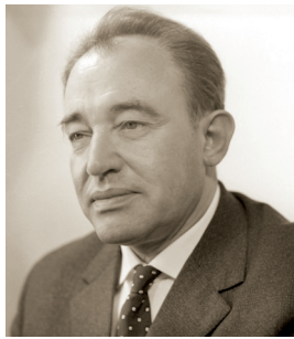
А. Е. Корнейчук