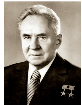
А. Н. Косыгин

КОСЫГИН Алексей Николаевич (08(21).02.1904, Санкт-Петербург — 18.12.1980, Москва), советский, государственный, партийный деятель, участник Гражданской войны, дважды Герой Социалистического Труда (1964, 1974). Окончил Ленинградский кооперативный техникум (1924), текстильный институт им. С. М. Кирова (1935). В 1919 ушел добровольцем в Красную Армию, служил до 1921. В 1920—1930-е работал в системе потребительской кооперации в Сибири. С 1935 на текстильной и прядильно-ткацкой фабриках в Ленинграде.