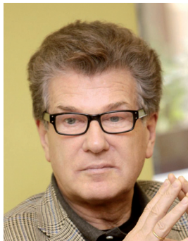
И. М. Костолевский

КОСТОЛЕВСКИЙ Игорь Матвеевич (10.09.1948, Москва), советский и российский актер театра и кино, заслуженный артист РСФСР, народный артист РФ (1995), лауреат Государственной премии РФ (2000). После окончания школы два года работал испытателем в НИИ кварцевой промышленности. В 1973 окончил ГИТИС, поступил в труппу академического театра им. В. Маяковского. С 1970 снимался в кино.