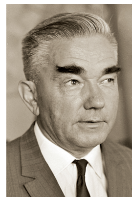
А. А. Котов

КОТОВ Александр Александрович (12.08.1913, Тула — 07.01.1981, Москва), советский шахматист и деятель шахматного движения, международный гроссмейстер (1950) и шахматный прозаик, участник турниров претендентов (1950, 1953), заслуженный мастер спорта СССР (1948), чемпион СССР по шахматам (1948), международный арбитр (1951), инженер-механик, член Союза писателей СССР. В школьные годы познакомился с шахматами. В 16 лет стал чемпионом Тулы. После окончания Тульского механического института Котов переехал в Москву. В годы Великой Отечественной войны работал главным конструктором одного из военных заводов. В составе сборной команды СССР победитель Олимпиад 1952 и 1954; успешно выступал в матчах против шахматистов Аргентины, Великобритании, Венгрии, США, ФРГ, ЧССР, Югославии. Заместитель председателя Шахматной федерации СССР, председатель правления ЦШК СССР (1956—1981). Главный арбитр мужских Олим-