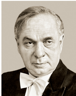
Р. И. Кофман

студенческого оркестра. В феврале 1981 выступал в Челябинске, исполнил Второй концерт для фортепьяно с оркестром Ю. Гальперина (первое исполнение). В 1990 возглавил Киевский камерный оркестр. В 2003—2008 работал в Германии как генеральмузикдиректор Бонна, возглавляя Бетховенский оркестр и Боннскую оперу. Продолжил работать на Украине с разными оркестрами. С 2012 главный дирижер Симфонического оркестра Национальной филармонии Украины. Награжден Большим крестом первого класса (офицерским крестом) ордена «За заслуги перед Федеративной Республикой Германия».