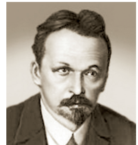
П. А. Красииков

КРАСИКОВ Пётр Ананьевич (05(17).10.1870, Красноярск — 20.08.1939, Железноводск), партийный и государственный деятель, один из создателей советской юстиции. Из семьи учителя. Окончил юридический факультет Петербургского университета. В 1892 примкнул к группе «Освобождение труда», позже член РСДРП, большевик. В 1894 выслан в Красноярск, где в 1897 познакомился с В. И. Лениным. С 1900 вел парторганизацию в Пскове, агент «Искры». Неоднократно арестовывался. В 1905 член Петербургского комитета РСДРП, исполкома Петросовета. С 1908 работал помощником присяжного поверенного (Петербург). С октября 1917 член следственной комиссии по борьбе с контрреволюцией и спекуляцией, член коллегии Наркомата юстиции. С марта 1918 заместитель наркомата юстиции РСФСР и председатель Кассационного трибунала при ВЦИК. Участвовал в разработке первых советских кодексов: гражданского и уголовного.