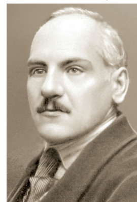
Н. В. Крыленко

КРЫЛЕНКО Николай Васильевич (02(14).05.1885, д. Бехтеево Сычевского уезда Смоленской губ. — 29.07.1938, Москва), советский, партийный и государственный деятель, участник революционного движения, Первой мировой войны. Окончил историко-филологический факультет Санкт-Петербургского университета (1909), юридический факультет Харьковского университета (1914). С 1904 занимался революционной деятельностью. Член РСДРП (с 1904), Военной