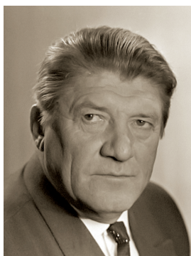
Н. А. Крючков