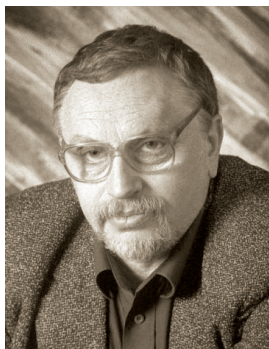
В. И. Ланцберг

26.10.2011 Москва, похоронен в Екатеринбурге), советский и российский кинорежиссер, заслуженный деятель искусств РСФСР (1970), народный артист РСФСР (1980), почетный гражданин Свердловской области (2000). Член КПСС с 1963. В 1930-е с семьей переехал во Владивосток. В 1944 с отличием окончил ВГИК (мастерская Л. Кулешова). Ассистент режиссера (с 1944), режиссер Свердловской киностудии. Режиссерские работы: 1958 — «Пора таежного подснежника»; 1968 — «Угрюм-река» (автор сценария), 1972 — «Приваловские миллионы» (автор сценария), 1983 — «Демидовы», 1990 — «Я объявляю вам войну» и другие фильмы. Первый секретарь Свердловского отделения Союза кинематографистов СССР (1967—1994). В марте 1981 в Челябинске принимал участие в «Творческом отчете Свердловской киностудии». С марта 2006 жил в Доме ветеранов кино «Матвеевское» (Москва). Лауреат Государственной премии РСФСР имени братьев Васильевых (1975). Награжден орденами Трудового Красного Знамени (1986), «За заслуги перед Отечеством» IV степени (2000), медалями.