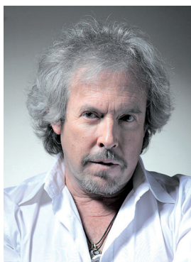
А. В. Макаревич