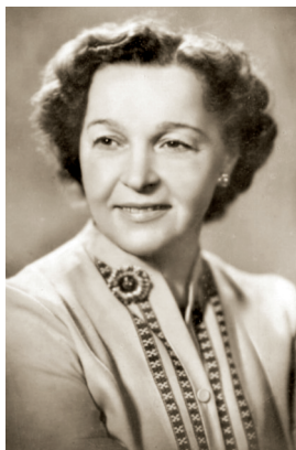
В. П. Марецкая

В 1971—1992 актриса Театра-студии киноактера. В феврале 2000 в Челябинске приняла участие во Всероссийской кинофестивале «Новое кино