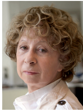
Л. М. Ахеджакова

АХЕДЖАКОВА Лия Меджидовна (09.07.1938, Днепропетровск, Украинской ССР), советская и российская актриса театра и кино, народная артистка Российской Федерации (1994). В 1956 поступила в Московский институт цветных металлов и золота, где проучилась полтора года. Окончила ГИТИС им. А. В. Луначарского (1962). С 1961 работала в Московском ТЮЗе, в амплуа трагедистки. С 1977 работала в театре «Современник». Сыграла на сцене множество разноплановых ролей. С 1973 снимается в кино: «Ирония судьбы, или С легким паром!» (1975), «Небеса обетованные» (1991), «Старые клячи» (2000) и другие фильмы. Лауреат Государственной премии РСФСР им. братьев Васильевых (1979) за исполнение роли секретарши Верочки в фильме «Служебный роман» (1977). В августе 1979 в Челябинске приняла участие в кинофестивале, посвященном 60-летию советского кино. В ноябре 1998 выступала в Челябинске (спектакль «Персидская сирень»). Награждена орденом Почета (1999), «За заслуги перед Отечеством» IV степени (2006).